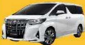
Alphard (2-4 ท่าน)