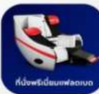
ที่นั่งพรีเมียมเฟล็กเซต