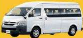
VAN (2-8 ท่าน)