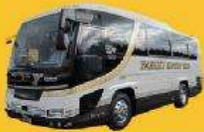
Bus (10-20 ท่าน)

➔ สำหรับท่านที่ต้องการความเป็นส่วนตัวมากขึ้น ท่านสามารถเลือกใช้บริการ รถส่วนตัวได้โดยมีรูปแบบรถให้เลือกถึง 3 ประเภท โดยรถ แต่ละประเภทสามารถนั่งได้ตั้งแต่ 2 ท่านขึ้นไป