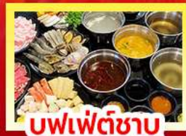
บุฟเฟต์ซาบู