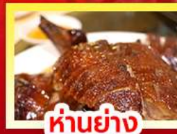
ห่านย่าง