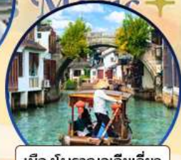
เมืองโบราณจูเจียเจีย