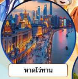
หาดไวทาน