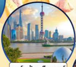
นอร์ทบิ้น กรีนแลนด์