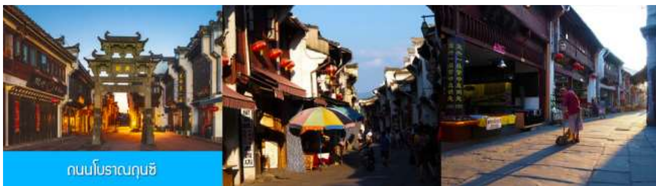
ถนนโบราณถุนซี

เที่ยง อิสระอาหารมื้อกลางวัน ( ท่านสามารถเลือกชิมอาหารพื้นเมืองในระแวกโรงแรมได้ตามอัธยาศัย )