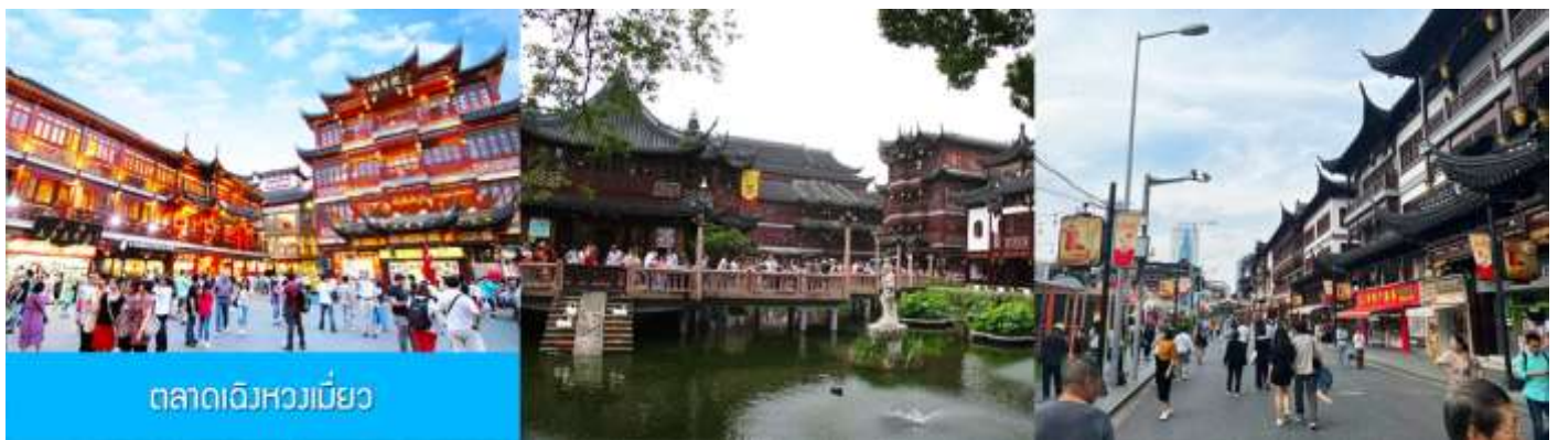
ตลาดเดินหวงเมี่ยว