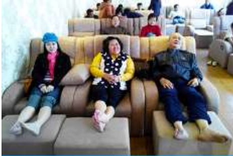
ศูนย์วิจัยแพทย์แผนจีน