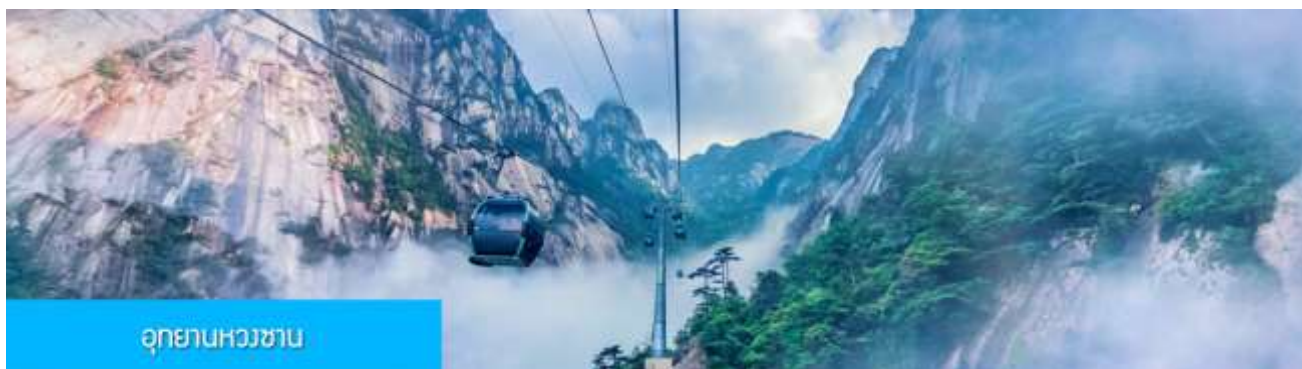
อุทยานหวางซาน