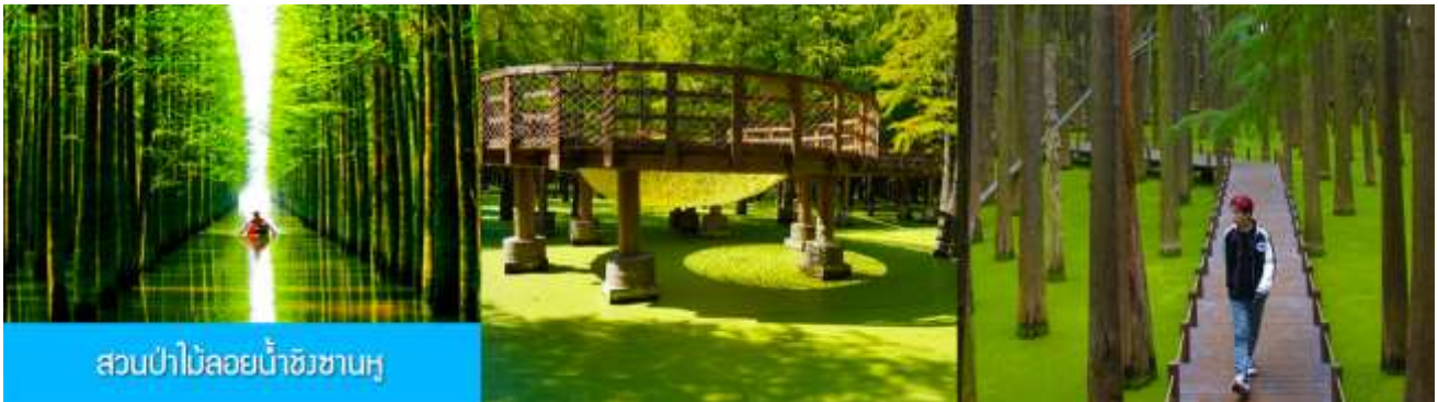
สวนป่าไม้ลอยน้ำชิงชานหู

หลังอาหารเช้าท่านเดินทางโดยรถบัสสู่เมืองหลิงอัน 临安市 (ระยะทาง 175 กม. ใช้เวลาเดินทางราว 2 ชั่วโมงเศษ)