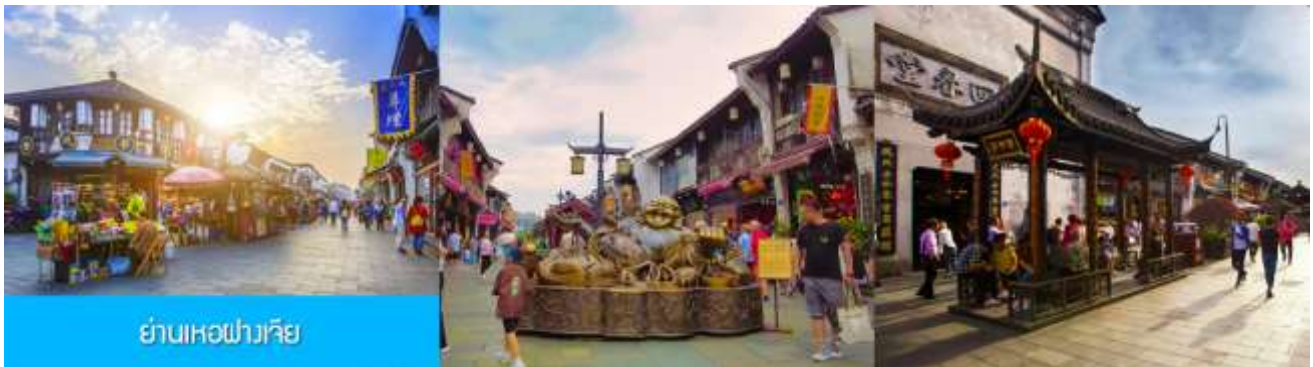
ย่านเหอฝางเจีย