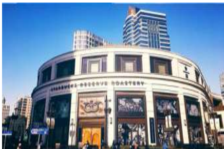
Starbuck Reserve Roastery