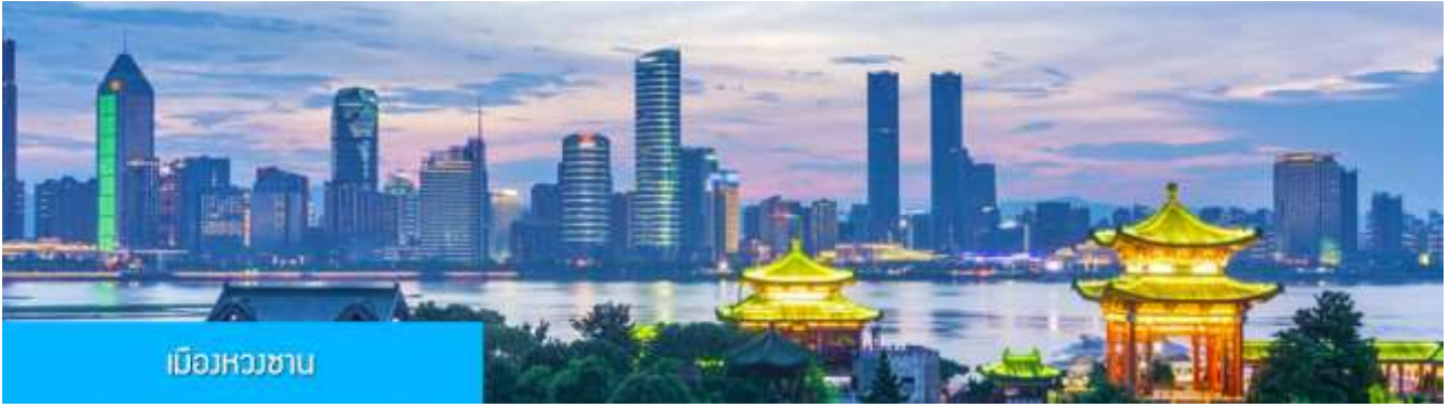
เมืองหวงซาน