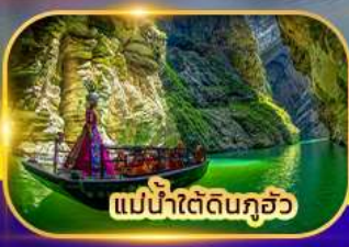
แม่น้ำใต้ดินกุ้อว