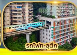
รถไฟฟ้าสุดค