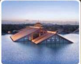
พิพิธภัณฑ์ไดน้ำกวางฟูหลิน