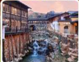
เมืองโบราณเหยาหู