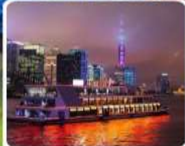
ส่องเรือแม่น้ำหวงผู่