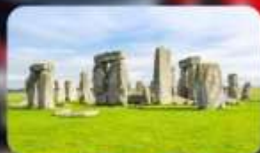
สโตเนเฮนจ์

Leonardo Hotel Liverpool หรือเทียบเท่า Leonardo Hotel Liverpool หรือเทียบเท่า DoubleTree by Hilton Stratford-upon-Avon หรือเทียบเท่า Courtyard By Marriott Oxford South หรือเทียบเท่า Courtyard By Marriott Oxford South หรือเทียบเท่า