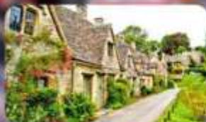
หมู่บ้านไบบิวรี