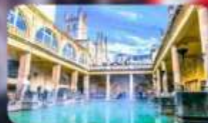
โรงอาบน้าโรมันบาร